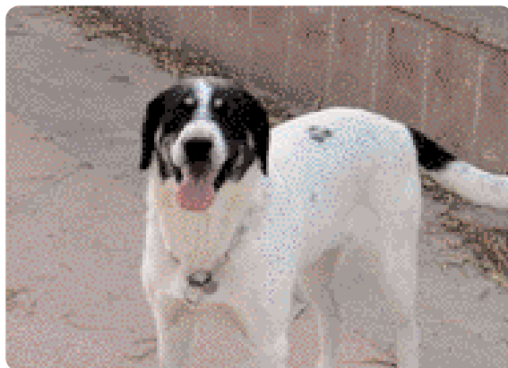
Figura 7 - Coda tenuta sotto la linea del dorso indica sottomissione.

Non si conosce ancora perfettamente il significato di questo segnale: è un comportamento complesso che riguarda sia la comunicazione olfattiva (agitando la coda, si diffondono nell'ambiente le secrezioni odorose emesse dalle ghiandole presenti a livello di regione anale e perianale) che visiva (il movimento della coda).